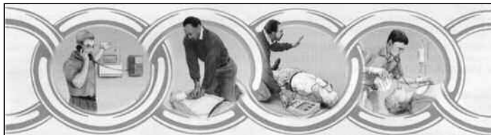
La catena della sopravvivenza

La rianimazione cardiopolmonare è costituita dal massaggio cardiaco esterno e dalla ventilazione bocca a bocca. In pratica una sequenza ritmica di 30 compressioni toraciche (massaggio cardiaco esterno) alternate a due insufflazioni di aria (ventilazione bocca a bocca), con un rapporto 30:2.