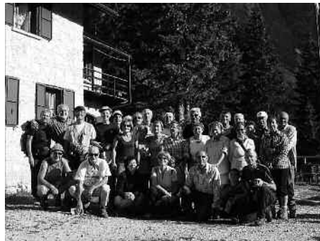
Il gruppo di Cuore Batticuore

In pochissimi minuti dal rifugio Tissi si raggiunge la cima, dove meravi-