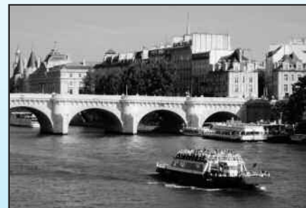
La Senna a Parigi

Un giorno, nel 1958, un medico austriaco emigrato a Baltimora, Peter Safar, pubblica una innovativa tecnica di soccorso per le vittime di arresto cardiaco: è la na-