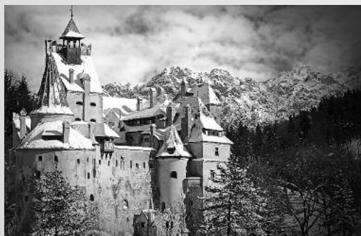
Il Castello di Dracula

Il nostro viaggio partirà dalla BUCOVINA (regione della Moldavia), dove tra bellissimi paesaggi visiteremo il monastero di VOIRONET con il suo "Giudizio universale"; il monastero di MOLDOVITA e quello di SUCEVITA con l'importante affresco "La scala delle virtù" e da ultimo il monastero di AGAPIA del XVII secolo. Tutti facenti parte del "Patrimonio mondiale dell'umanità".