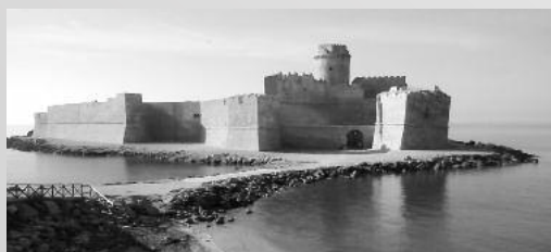
Il Forte di Caporizzuto

La vacanza è completamente organizzata dall'agenzia GRUPPO VIAGGI di Dalmine. Presso la sede di Cuore Batticuore sono a disposizione tutte le informazioni relative alle vacanze marine presso il SERE-