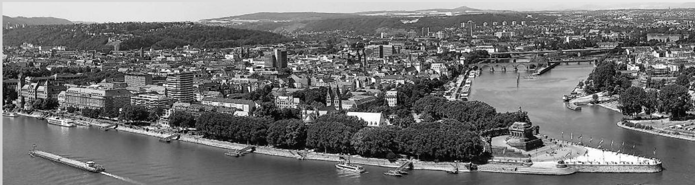
Confluenza tra i fiumi Mosella e Reno

Come annunciato nel precedente numero di Bergamo Cuore, per la tradizionale ciclogita primaverile Cuore Batticuore e Cuore... Sport hanno scelto per l'anno 2016 la pista ciclabile lungo i fiumi Saar, Mosella e Reno nel periodo da sabato 21 a sabato 28 maggio.